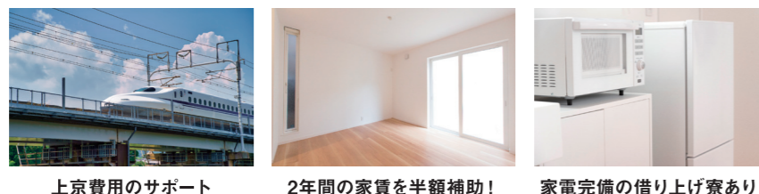
上京費用のサポート